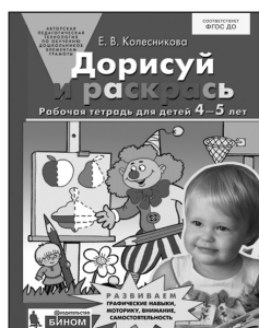
«Дорисуй и раскрась». Рабочая тетрадь для детей 4–5 лет