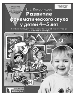
«Развитие фонематического слуха у детей 4–5 лет». Учебно-методическое пособие